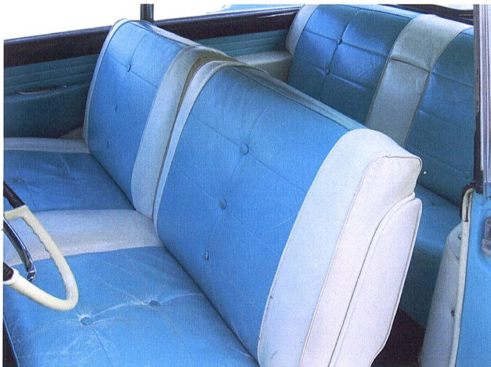
Vaade sõiduki istmetele (polsterdusele)