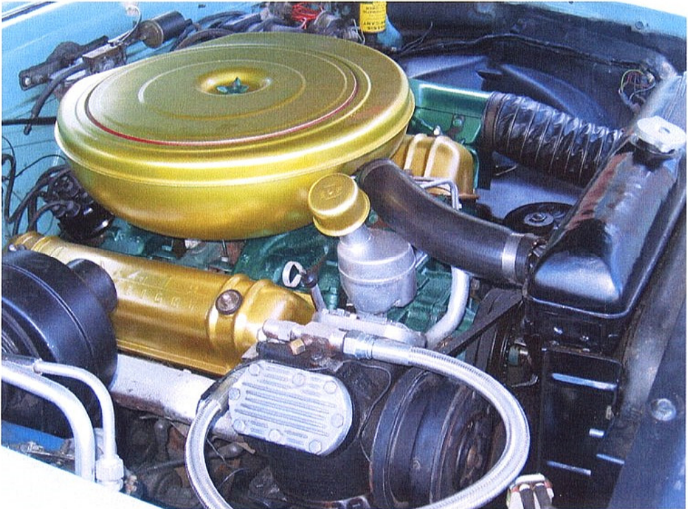
Vaade mootoriruumile vastassuunast