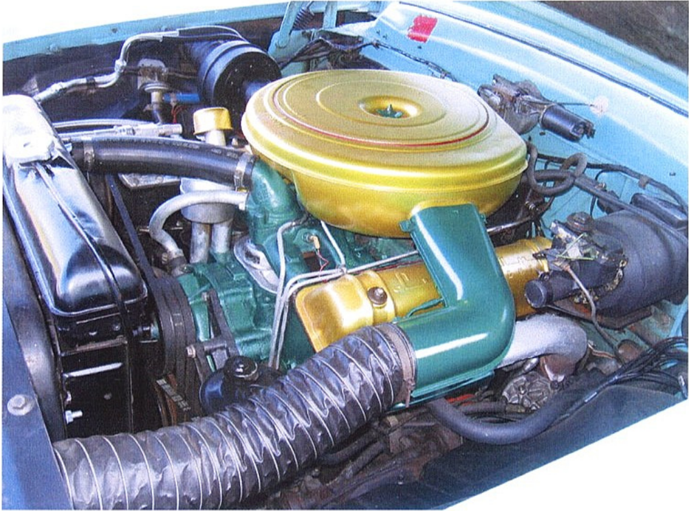
Vaade mootoriruumile vasakult või sõltuvalt mootoriruumi katte paigutusest muust suunast